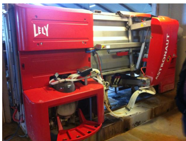
Besøg hos Skårupgård ved Klejtrup. Fulldautomatisk malke robot, som køerne selv finder ud af at bruge 2,8 gange i døgnet. Og de elsker det.