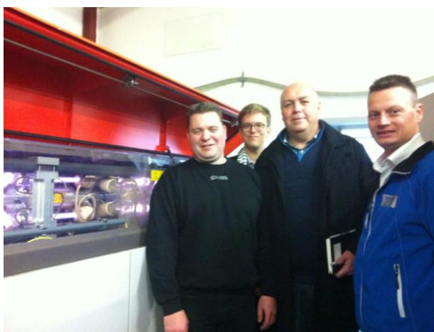
Besøg hos virksomheden Leth Steel i Skals.

Tirsdag den 29/10 havde jeg den store fornøjelse at aflægge et heldagsbesøg på Møldruppegnen nord for Viborg. Dagens program bød på besøg hos ikke mindre end 5 velfungerende virksomheder, der på hver deres måde bidrager til beskæftigelse og velstand. Under besøgene fulgtes jeg med engagerede lokale V-byråds kandidater og organisationsfolk. Dagen blev afsluttet med et levende fyraftensdebatmøde hos turistattraktionen Verdenskortet i Klejtrup. Og så blev der serveret god gammeldags flæskesteg med brunede kartofler og brun sovs - lækkert. Tak for en rigtig god og lærerig dag!